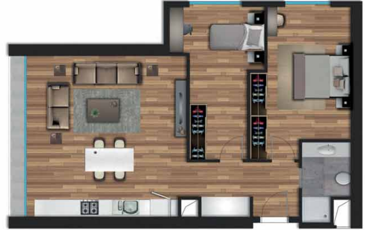
2+1 A örnek daireye ait, bilgisayarla üretilmiş örnek görsel.

Giriş Holü: 7,05 m 2 Salon + Mutfak: 29,45 m 2 Ebeveyn Yatak Odası: 16,20 m 2 Yatak Odası: 13,45 m 2 Banyo: 4,12 m 2 Balkon: 3,35 m 2 Net Alan: 73,62 m 2 Daire Brüt Alan: 86,82 m 2 Genel Brüt Alan: 120,74 m 2