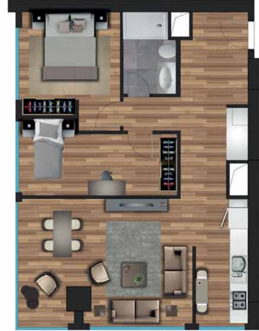
2+1 B örnek daireye ait, bilgisayarla üretilmiş örnek görsel.

Giriş Holü: 5,85 m 2 Salon: 23,50 m 2 Mutfak: 7,15 m 2 Ebeveyn Yatak Odası: 11,70 m 2 Yatak Odası: 11,40 m 2 Banyo: 4,28 m 2 Hol: 8,15 m 2 Net Alan: 72,03 m 2 Daire Brüt Alan: 84,78 m 2 Genel Brüt Alan: 118,13 m 2