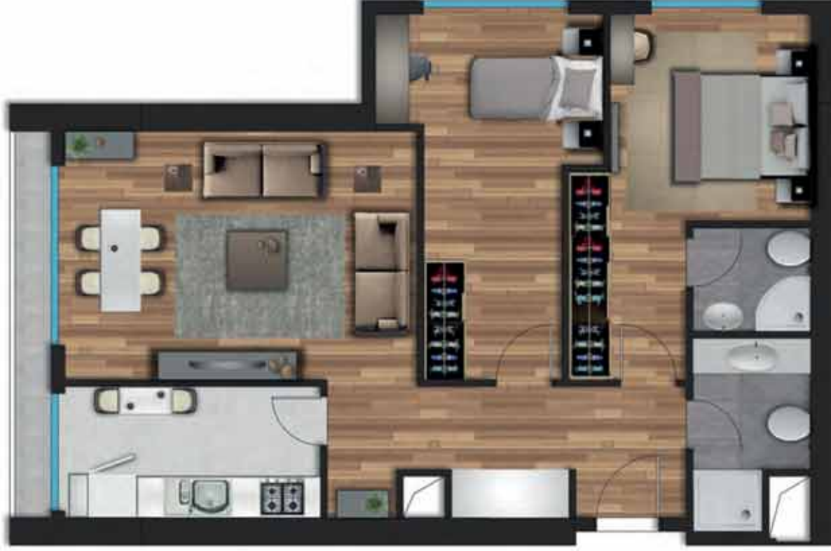
2+1 A örnek daireye ait, bilgisayarla üretilmiş örnek görsel.

Giriş Holü: 7,05 m 2 Salon: 21,00 m 2 Mutfak: 7,35 m 2 Ebeveyn Yatak Odası: 13,40 m 2 Ebeveyn Banyo: 2,55 m 2 Yatak Odası: 13,45 m 2 Banyo: 4,12 m 2 Balkon: 3,35 m 2 Net Alan: 72,27 m 2 Daire Brüt Alan: 86,82 m 2 Genel Brüt Alan: 120,74 m 2