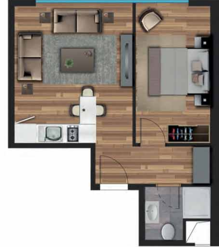
1+1 B örnek daireye ait, bilgisayarla üretilmiş örnek görsel.

Giriş Holü: 4,42 m 2 Salon + Mutfak: 17,40 m 2 Yatak Odası: 10,80 m 2 Banyo: 2,94 m 2 Net Alan: 35,56 m 2 Daire Brüt Alan: 42,12 m 2 Genel Brüt Alan: 59,39 m 2