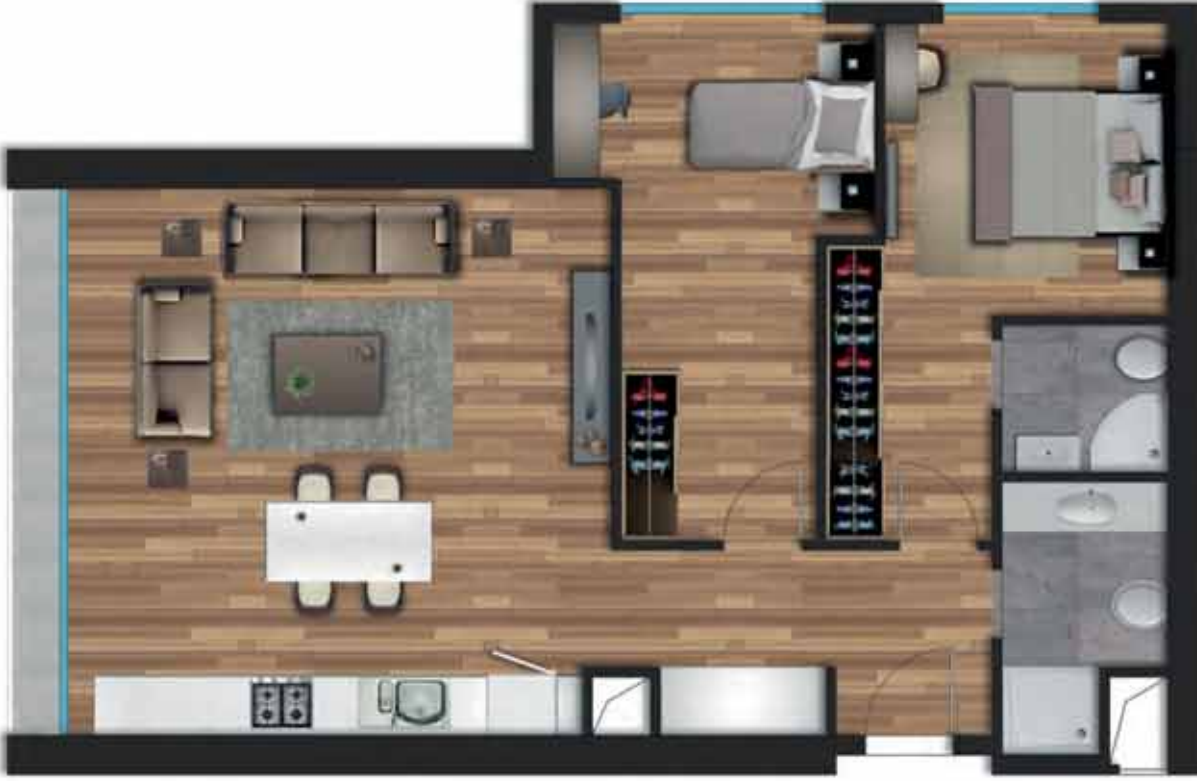
2+1 A örnek daireye ait, bilgisayarla üretilmiş örnek görsel.

Giriş Holü: 7,05 m 2 Salon + Mutfak: 29,45 m 2 Ebeveyn Yatak Odası: 13,40 m 2 Ebeveyn Banyo: 2,55 m 2 Yatak Odası: 13,45 m 2 Banyo: 4,12 m 2 Balkon: 3,35 m 2 Net Alan: 73,37 m 2 Daire Brüt Alan: 86,82 m 2 Genel Brüt Alan: 120,74 m 2