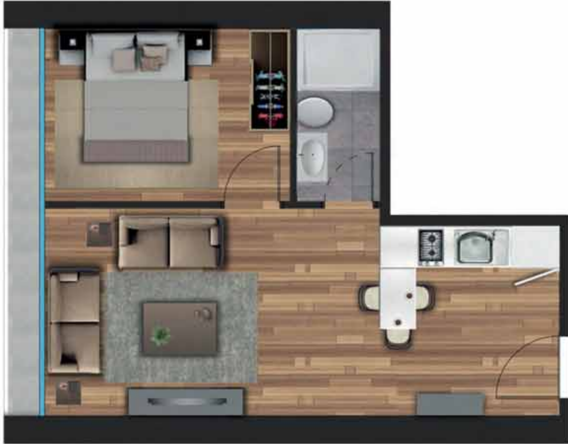
1+1 C örnek daireye ait, bilgisayarla üretilmiş örnek görsel.

Salon + Mutfak: 20,80 m 2 Yatak Odası: 8,10 m 2 Banyo: 3,00 m 2 Balkon: 3,35 m 2 Net Alan: 35,25 m 2 Daire Brüt Alan: 42,22 m 2 Genel Brüt Alan: 58,87 m 2