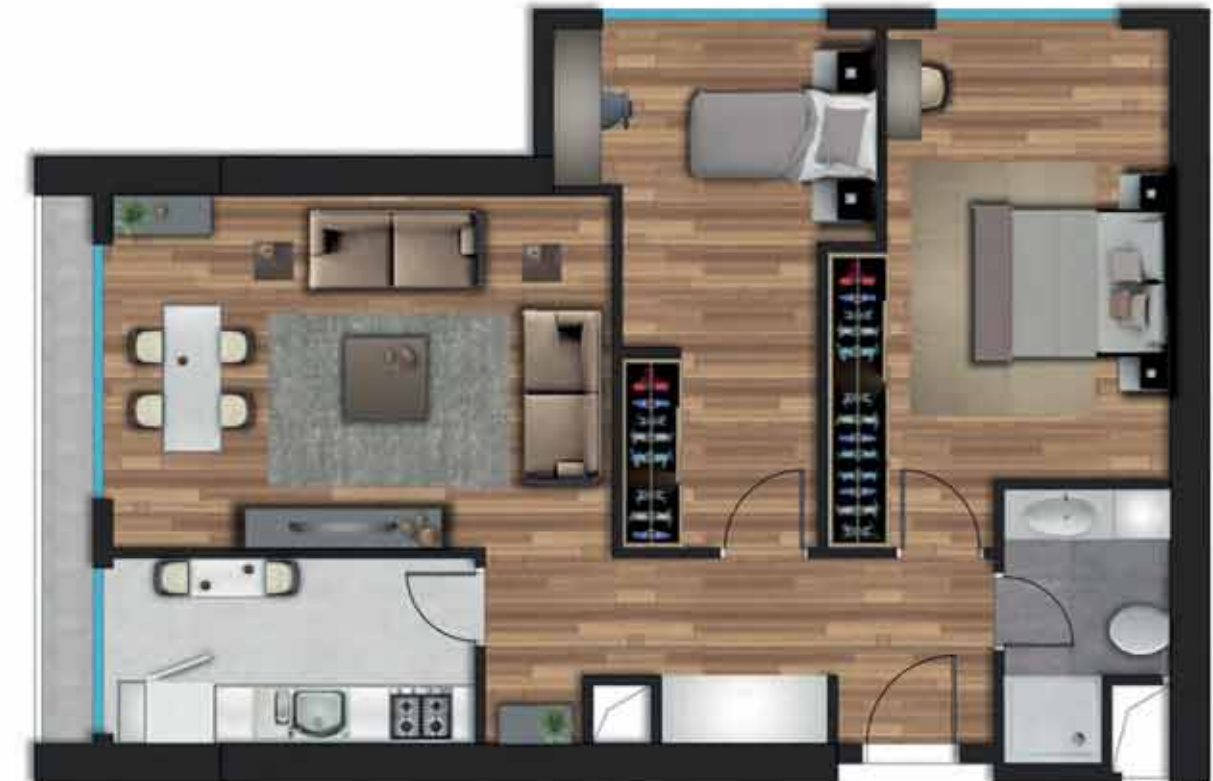
2+1 A örnek daireye ait, bilgisayarla üretilmiş örnek görsel.

Giriş Holü: 7,05 m 2 Salon: 21,00 m 2 Mutfak: 7,35 m 2 Ebeveyn Yatak Odası: 16,20 m 2 Yatak Odası: 13,45 m 2 Banyo: 4,12 m 2 Balkon: 3,35 m 2 Net Alan: 72,52 m 2 Daire Brüt Alan: 86,82 m 2 Genel Brüt Alan: 120,74 m 2