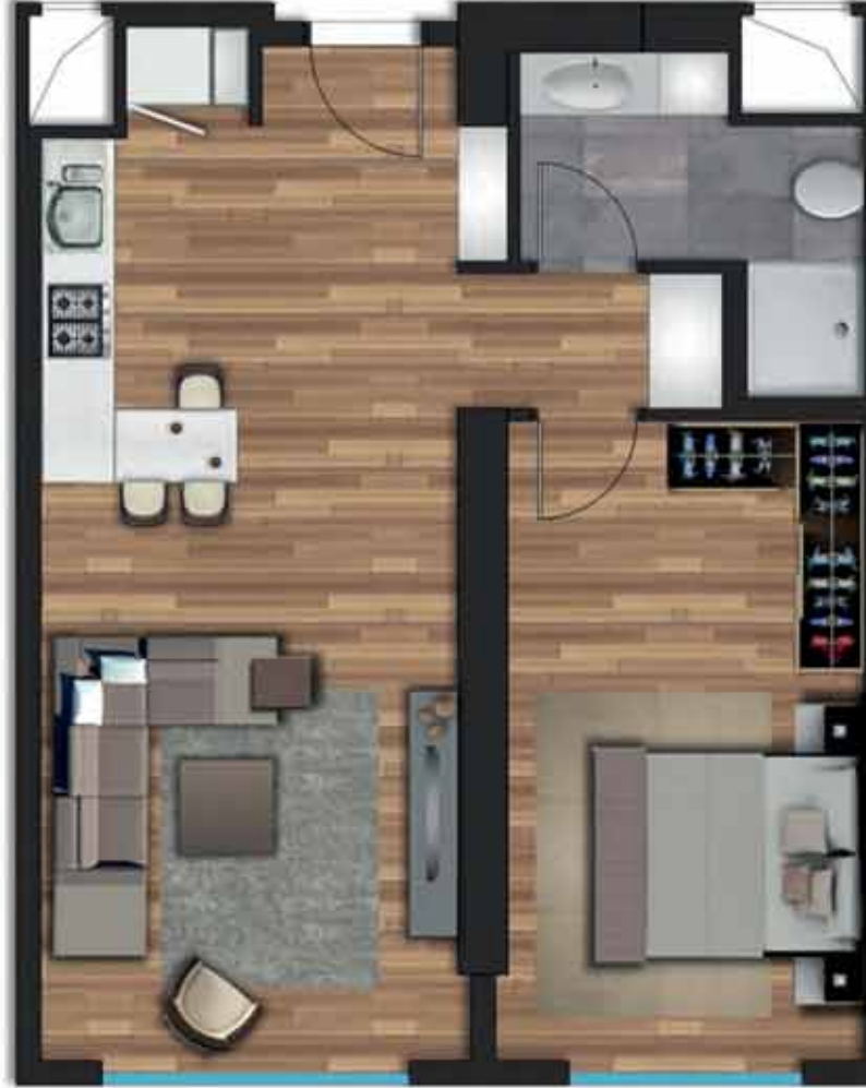
1+1 A örnek daireye ait, bilgisayarla üretilmiş örnek görsel.

Salon + Mutfak: 28,50 m 2 Yatak Odası: 15,50 m 2 Banyo: 5,10 m 2 Hol: 2,36 m 2 Net Alan: 51,46 m 2 Daire Brüt Alan: 61,35 m 2 Genel Brüt Alan: 82,85 m 2